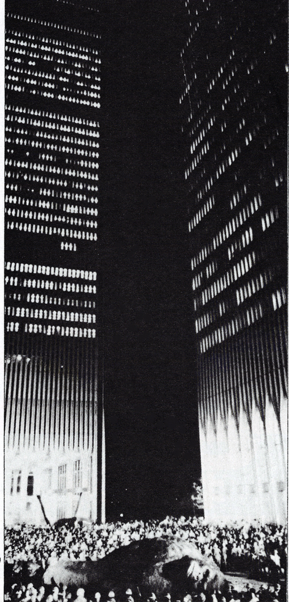
●6万人にかこまれてクライマックスの撮影 (6.21 N.Y.世界貿易センタービル前)

星、ジェシカ・ラング。また、キングコングを発見する若き人類学者に「ラスト・ショー」でアカデミー賞にノミネートされたジェフ・ブリッジス。