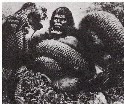
●大蛇に襲われたコングの死闘!

「戦争と平和」「天地創造」などの超大作でハリウッドに乗り込み、今や世界中のマスコミから注目を集めている大プロデューサー、ディーノ・デ・ラウレンティスがこの巨大作に揃えた超特級の顔ぶれ……。