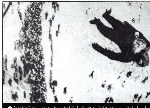
●初めてペールをぬいだ巨大なコングにおしかける人、人

この「キングコング」の企画が発表されるやたちまち全米の各劇場から'76年末のクリスマス上映の申し込みが殺到。撮影開始までの間になんと2000劇場との契約が成立した。劇場網がその後もどんどん拡大して行く状況の中でいよいよ撮影が開始されたのである。先ずキングコングが登場しないシーンから順調に撮影が進行。いよいよ6月21日、それまで全く極秘であった主役のコングが登場したのである。その日ラストシーンの撮影のためにニューヨークノッポの世界貿易センタービルへ運ばれた巨大なコングを見ようと集まった市民は6万人にもふくれ上った。だが、この日のコングはほんの片鱗を見せたにすぎず、「真打ちコング」登場が待たれている。