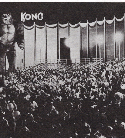
●一大パニックに陥入った満場の観衆

この超大作の「キングコング」に世界中の映画人が寄せる期待はかつてないほど高まり、ついに公開前に全世界で2200都市を結ぶ地球上初の2700劇場超拡大公開を決定。日本でも洋画では初の全国縦断超拡大170劇場で77年新春ロードショーが決定した。