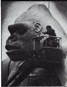
●仕上げを待つキングコング 「タイム」誌 5.24