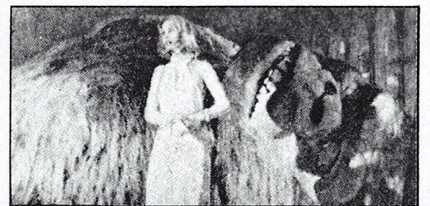
●コングの前に立つジェシカ・ラング