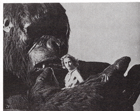
●美女と野獣。コングの大きさを見よ!

■史上空前!12月18日、全世界2200都市2700劇場(日本109都市170劇場)を結び一斉超拡大ロードショー!