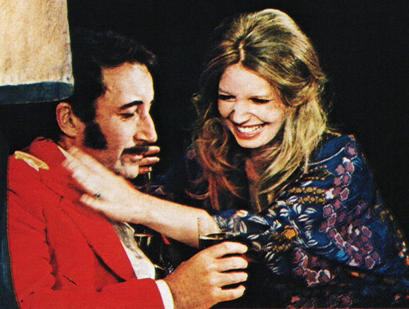
"the RETURN of the Pink Panther"

Copyright © MCMLXIV MIRISCH GEOFFREY. All rights reserved.