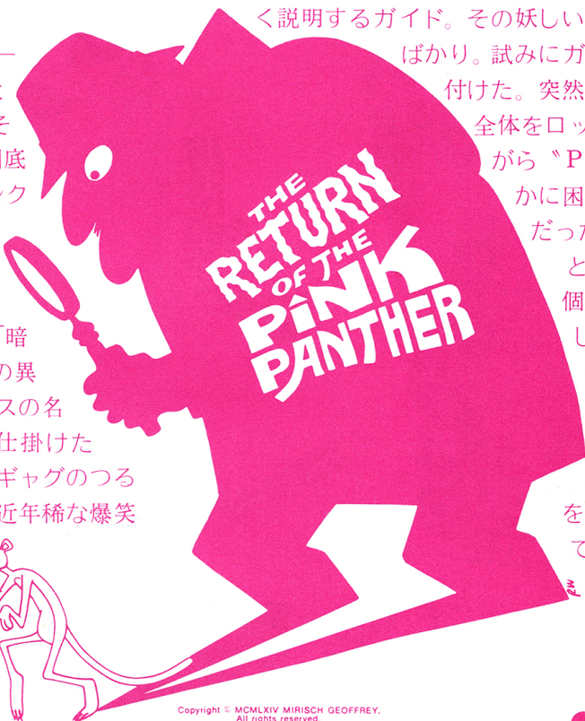
Copyright © MCMXLIV MIRISCH GEOFFREY. All rights reserved.

ート・ロムがクルーゾーの不条理な行動に神経を逆撫でされるドレフュス署長を好演。そして怪盗ファントムに「らせん階段」のクリストファー・ブラマー、その妻に「ドラブル」の新星カトリーヌ・シェルが色を添える。マラケシュ、カサブランカ、ニース、グシュタート(スイス)とカラフルなロケ撮影を担当したのは「キャバレー」「オリエント急行殺人事件」の名手ジョフリー・アンズワース。音楽は第一作以来のヘンリー・マンシーニで、得意の中東調でムードを盛り上げている。