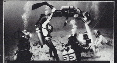
史上初！35ミリカメラが海中に

美しいバミュータの深海で見つけた難破船…ハネムーンの楽しい冒険は、やがて二人を目もくらむ恐怖の底へ！