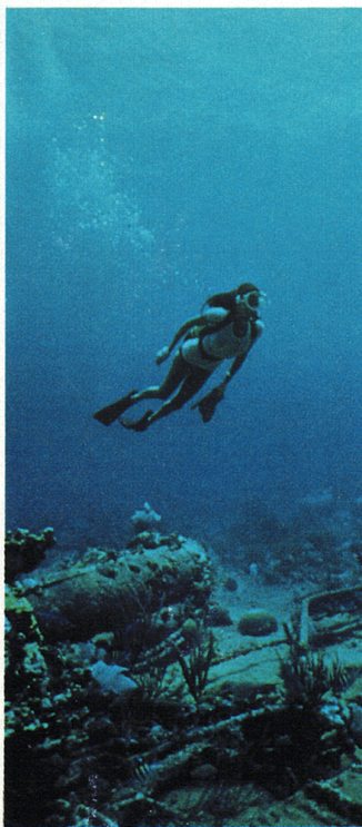
パナビジョン ■ カラー作品 コロムビア映画超大作

コロムビア映画 / EMI 提供 ■ カサブランカ・フィルムワークス・プロダクション ■ ピーター・イエーツ・フィルム