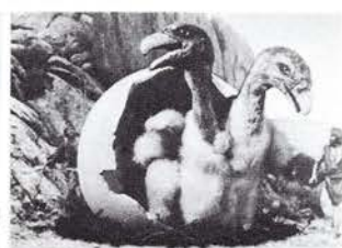
象より大きい双頭のワシのヒナが生まれて…