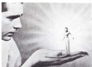
魔法にかかって王女は一寸法師に…