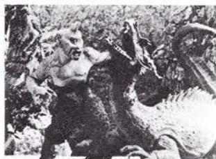
一つ目巨人と巨龍のもの凄い闘い