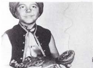
魔法のランプの精が助けるのは？