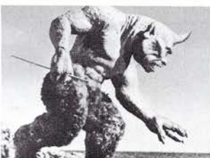
上陸した島には恐ろしい一つ目巨人が…