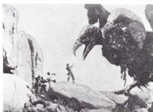
ジェット機より早い巨大な双頭のワシの恐怖