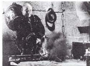
小人を元の人間に戻す秘薬の行方は？