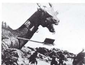
火を吐く巨龍が人間を襲う…