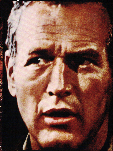
PAUL NEWMAN as ROBERTS The Architect

スチーブ・マックイーン ホール・ニューマン ウィリアム・ホールデン フェイ・ダナウェイ