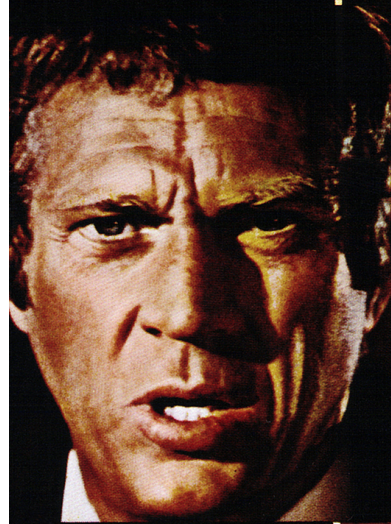
STEVE McQUEEN as O'HALLORHAN The Fire Chief